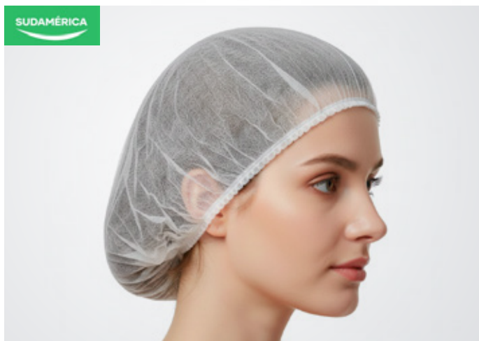
Tocas Color: Marca: Sudamerica Precio: