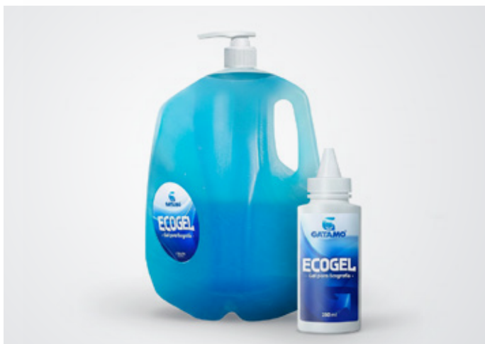
Gel para ecografía