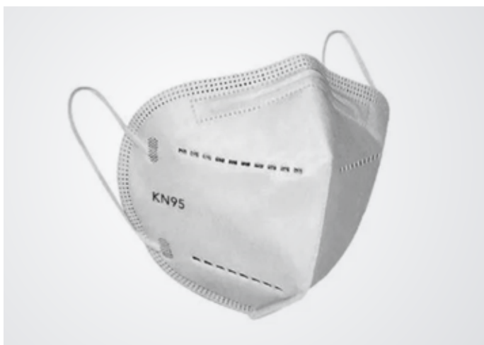
Mascarilla Color: Marca: KN95 Precio: Variable