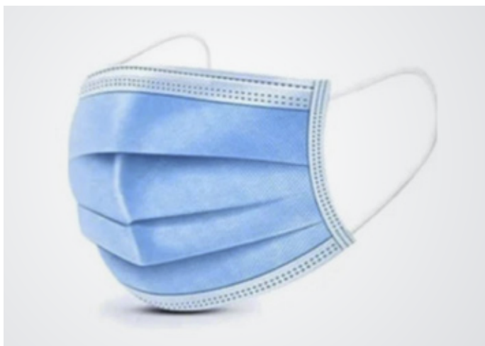
Mascarilla 3 pliegues Color: Marca: ??? Precio: Variable