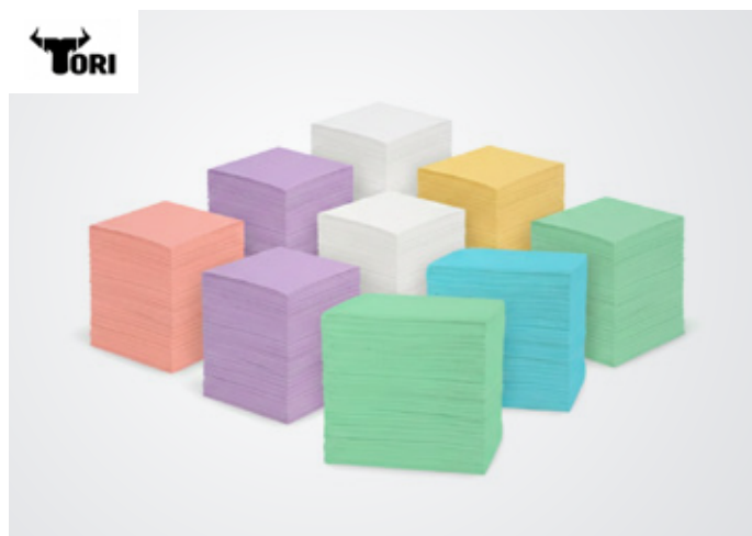
Campos dentales Color: Todos Marca: Tori Precio: S/ 65.00