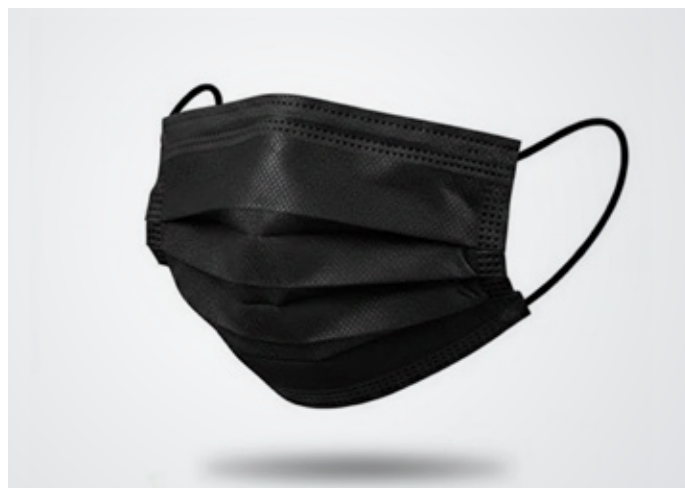
Mascarilla Color: Marca: Koreana Precio: Variable