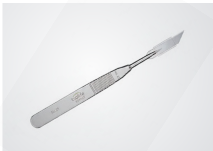
Bisturí Marca: Biolife Cajita Precio: S/ 20.00 Biolife Cajón Precio: S/ 18.00