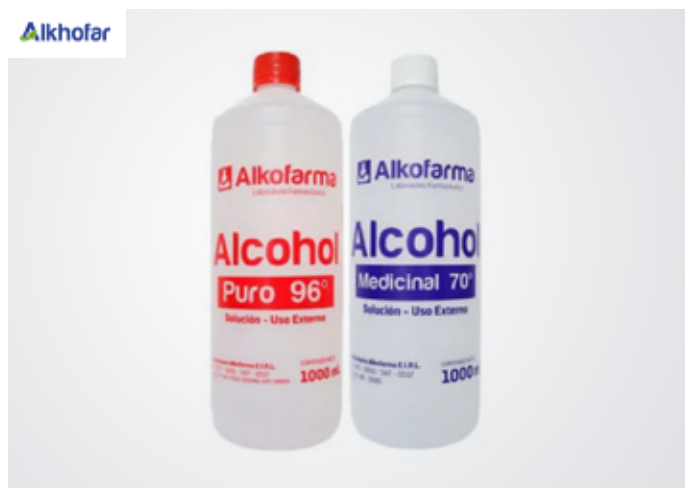
Alcohol de 70° y 96° Marca: Alkhofarm Precio: S/