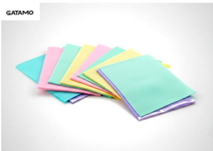
Campos dentales Color: Todos Marca: Gatamo Precio: S/ 60.00