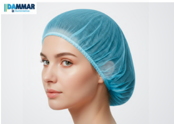
Tocas Color: Marca: Dammar Precio: