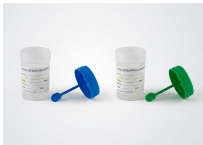
Pomos para análisis con espátula Color: Marca: ??? Precio: S/ 65.00