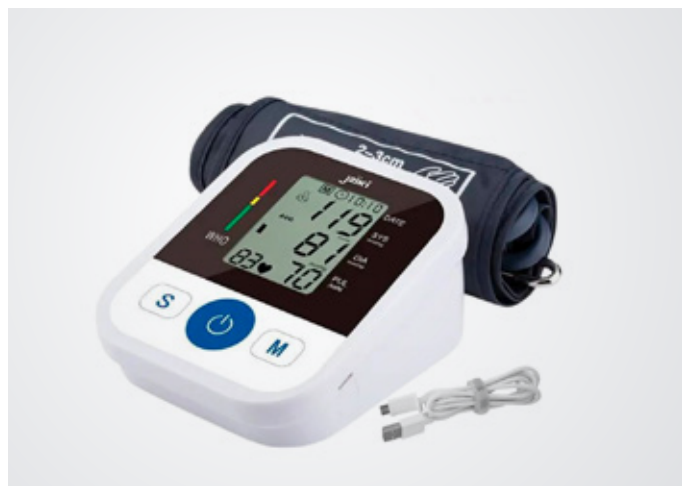
Tensiómetro de brazo Bolaño