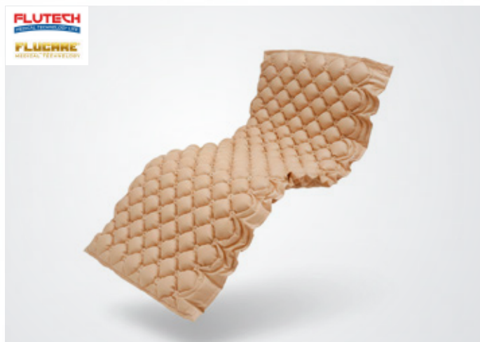
Colchón antiescaras Marca: Flutech Flucare Precio: Variable